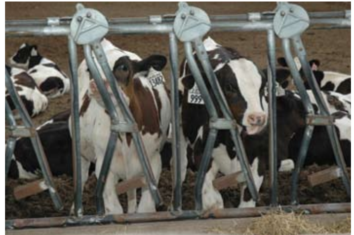
▲1HO02565 CASSINO Terneros de la granja Dyecrest en Colorado.

Hoy en día, la genómica ha tenido un mayor impacto en la industria porque el analizar el ADN de un ternero puede determinar la habilidad genética de ese animal con una confiabilidad mucho más alta que la de los promedios de los padres.